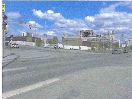
Адаптированные сходы/съезды на проезжую часть дороги с тротуара