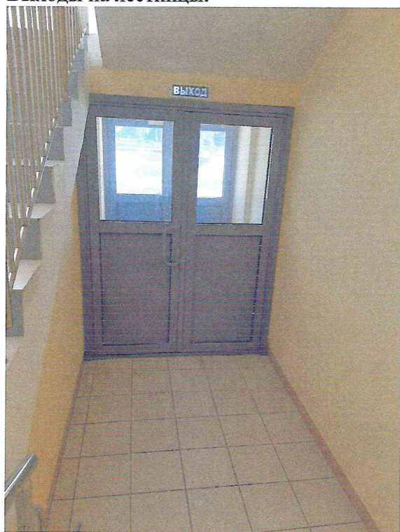
Эвакуационный выход изнутри здания.