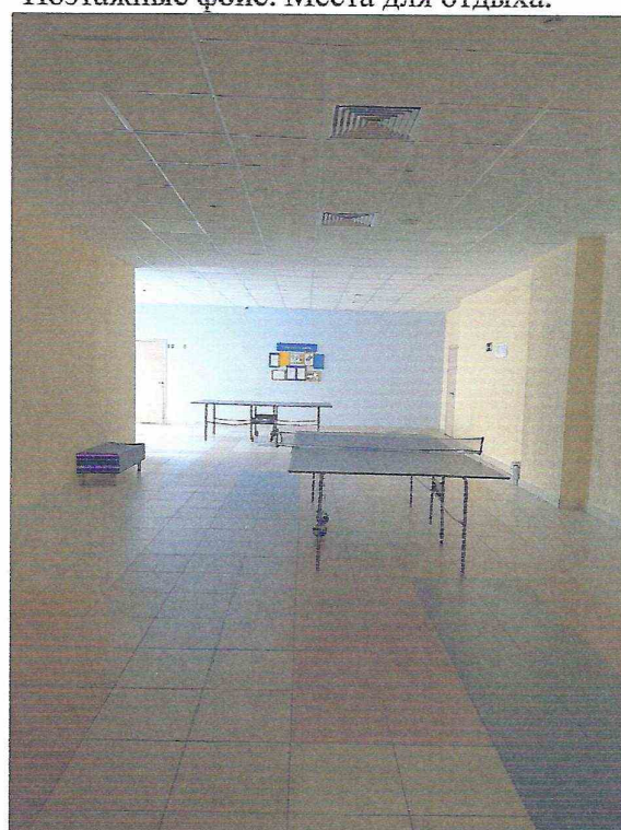
Фойе возле спортзалов.