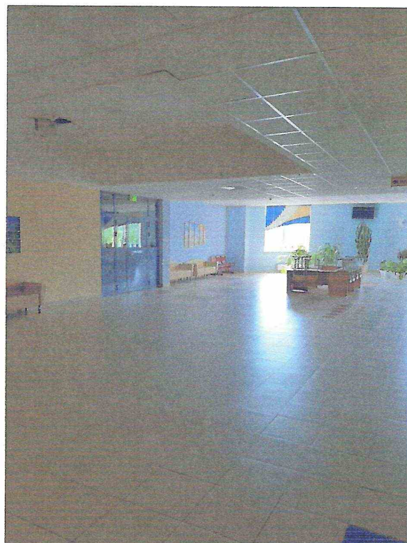
Поэтажные фойе. Места для отдыха.