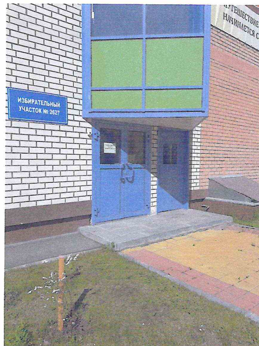
Один из эвакуационных входов