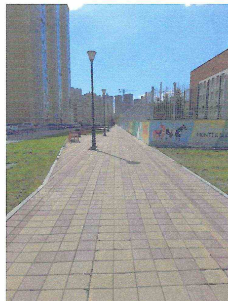
Прилегающая территория пути следования