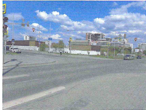
Адаптированные сходы/съезды на проезжую часть дороги с тротуара