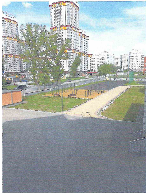
территория со стороны пр.Уктусский