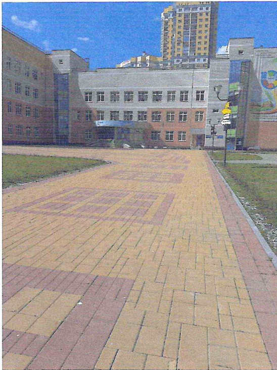
Школьный двор со стороны ул.Союзной