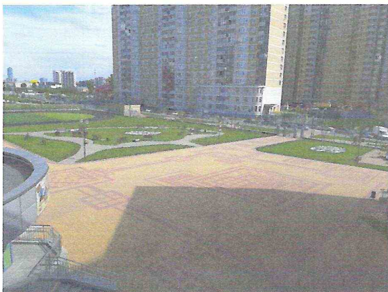
Школьный двор, зона отдыха