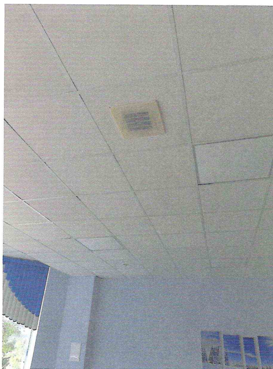
Система противопожарной безопасности