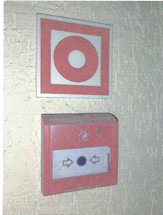
Кнопка пожарной сигнализации