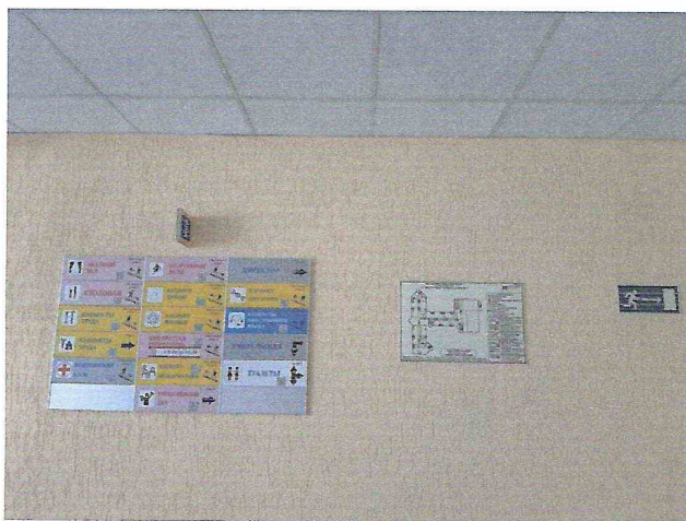
Система информации (позтажная)