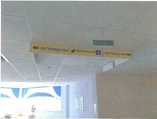
Потолочные направляющие и информационные табло