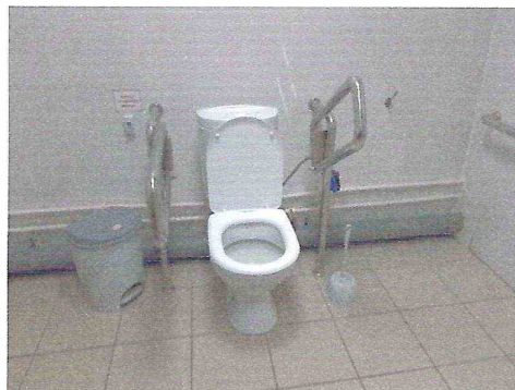
Информационная таблица туалета