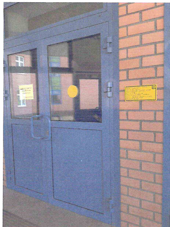
Центральный вход, литер А