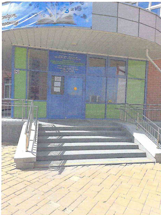
Центральный вход, литер А