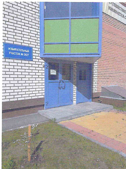
Один из эвакуационных входов