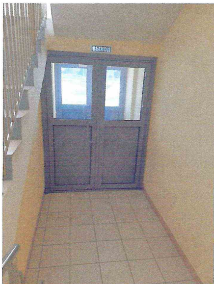
Эвакуационный выход (вид изнутри).